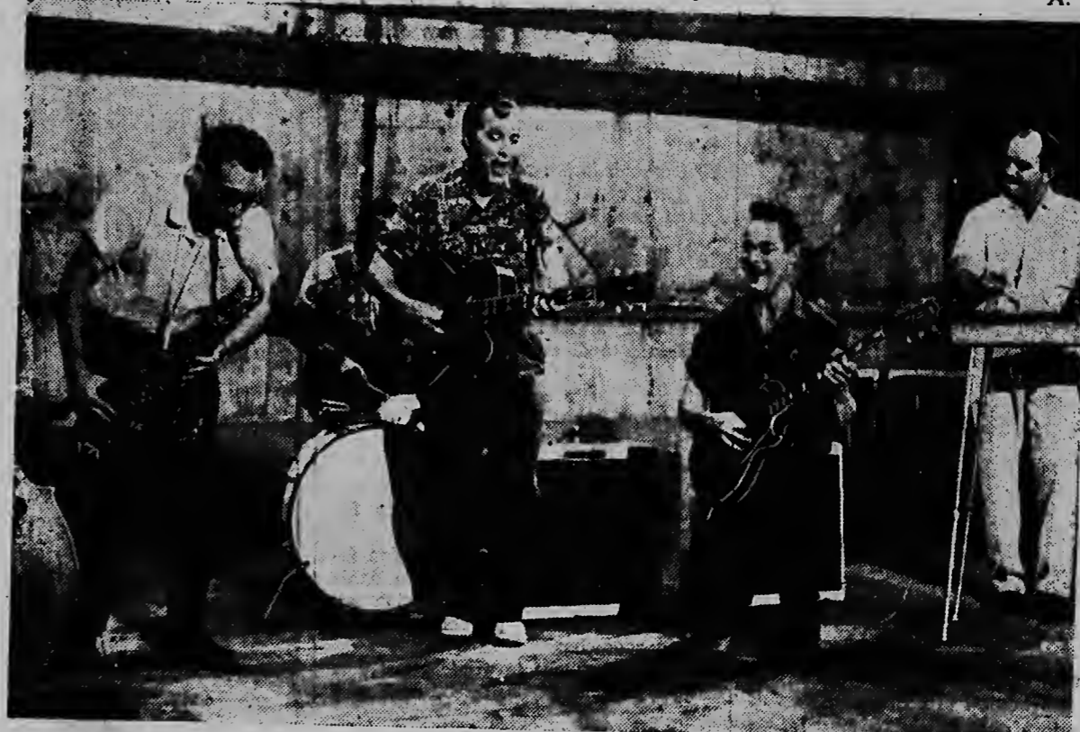
Bill Haley and his comets in „Don't knock the Rock”.

Gaarne zijn wij bereid de Stenorette geheel vrijblijvend bij U op kantoor te komen demonstreren.